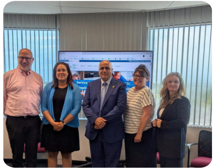
Des membres de l'équipe de haute direction de SCS avec le député provincial George Darouze