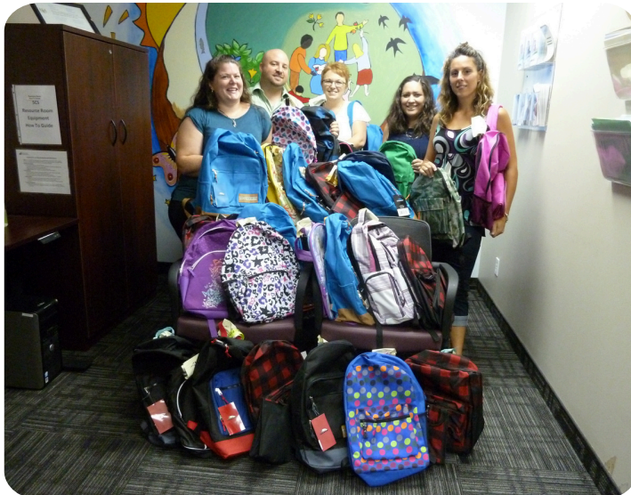
Campagne de sacs à dos de SCS