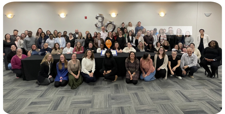
Événement de reconnaissance du personnel et célébration du 30e anniversaire