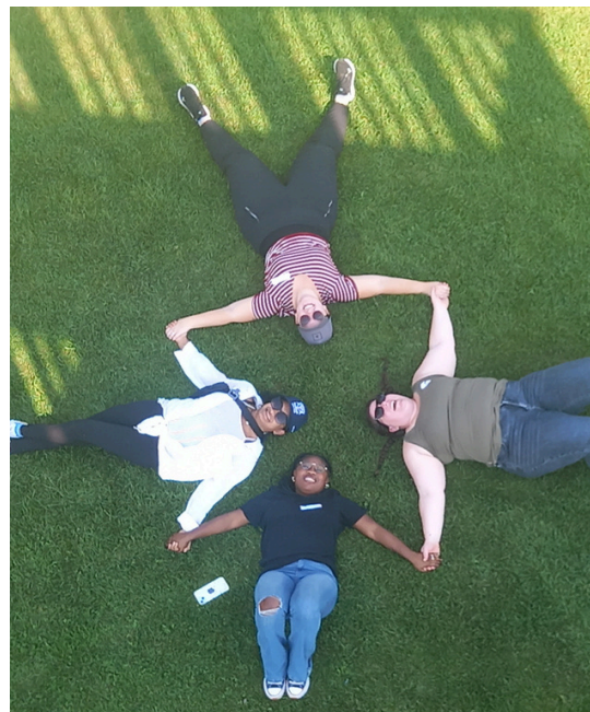
(Photo: Le personnel de SCS pose pour une photo de groupe à la ferme Saunders)

L'élargissement prévu du programme reflète la demande croissante, les résultats positifs observés et, en fin de compte, un rôle croissant dans la prévention des ruptures de placement et le soutien aux familles pour maintenir leur capacité à poursuivre leur rôle de proche aidant.