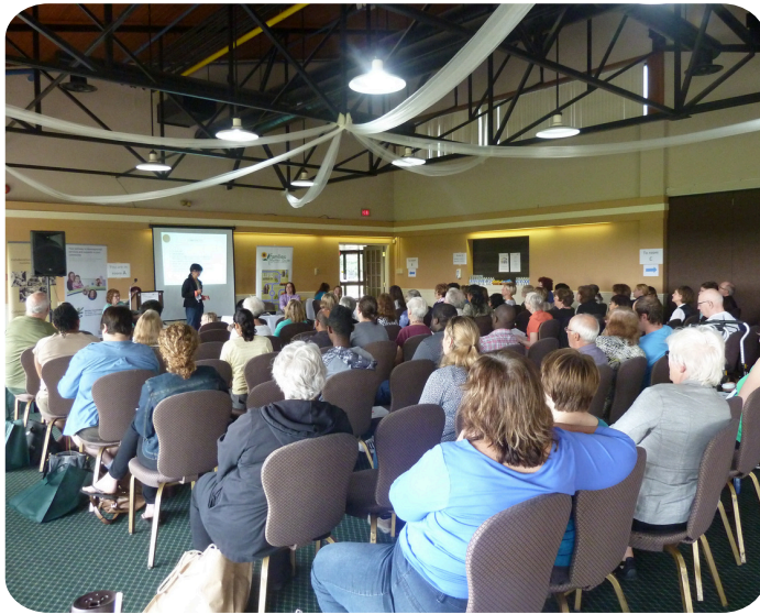
Événement communautaire TAG de SCS